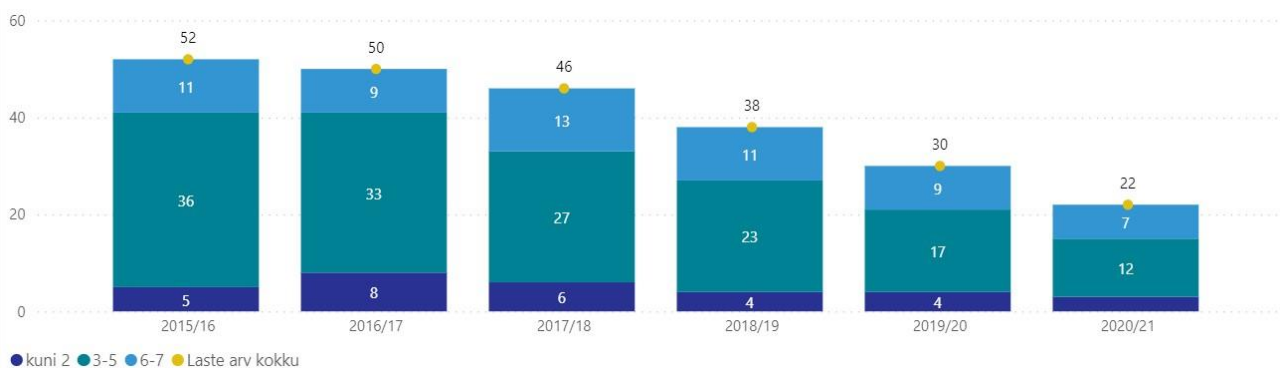
Joonis nr 1. Laste arvu muutus Tsirguliina lasteaias.

Laste arvu muutus Tsirguliina Kooli lasteaias on näha joonisel nr 1.